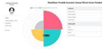
Gambar 5. Halaman Beranda

input data, analisa data, dan account. Di halaman beranda aplikasinya juga terdapat gambar graph. Adapun ambar halaman beranda dapat dilihat pada Gambar 5.