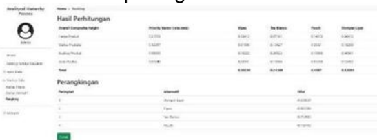
Gambar 7. Rangking

Halaman ini berisikan hasil dari perhitungan akhir beserta susunan rangkingnya, ditunjukkan pada gambar 7 berikut ini.