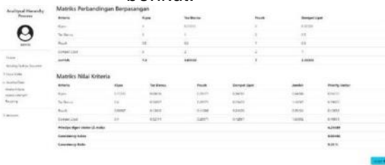
Gambar 6. Halaman Hasil

Pada halaman hasil terdapat hasil dari perhitungan kriteria untuk membandingkan alternatif produk yang 8 nantinya dipilih, langkah berikutnya yaitu menentukan nilai kriteria. Semua kriteria yang ada diberi nilai sebagaimana dengan persepsi responden. Yang ditunjukkan pada gambar 6 berikut.