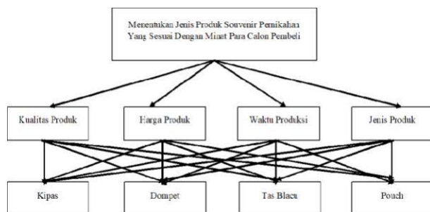
Gambar 3. Struktur Hierarki

Penyusunan hierarki dimulai dengan menentukan tujuan yang hendak dicapai, setelah itu menetapkan kriteria dan alternatif. Penyusunan hierarki dapat dilihat pada gambar berikut ini: