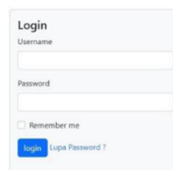
Gambar 4. Halaman Login

Pada halaman ini merupakan tampilan awal dari aplikasi ini, dimana user diminta untuk mengisi username dan password